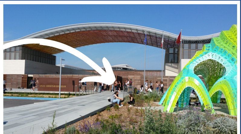
Lycée Polyvalent Christian Bourquin 4 Av. Nelson Mandela, 66700 Argelès-sur-Mer