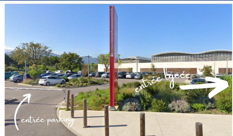
Parking gratuit accessible, à l'entrée du Lycée