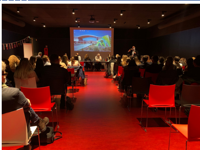
16h30 : Salle de conférence