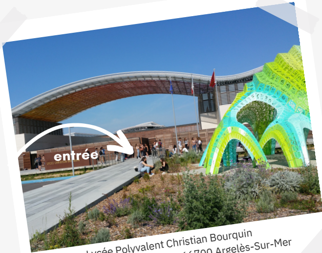
Lycée Polyvalent Christian Bourquin 4 Avenue Nelson Mandela 66700 Argelès-Sur-Mer

AG 8 JUILLET 2023 – 4 AV. NELSON MANDELA, 66700 ARGELES SUR MER