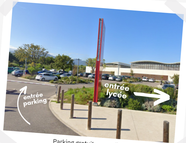
Parking gratuit accessible